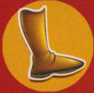
Boot - Cizmă