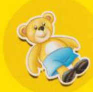
Teddybear - Ursuleț de pluș