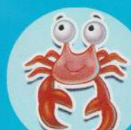
Crab - Crab